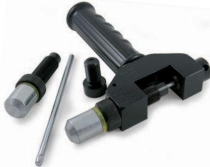
Ketten Niet-/ Trennwerkzeugset

Werkzeuge für verschiedene Kettenteilungen, inkl. den benötigten Niet-/ und Trennbolzen