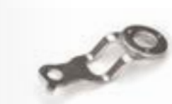
optional 243-H82: Halter für Honda und KTM.