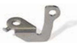
optional 243-BT1: Halter z. seitl. Befestigung Kupplung o. Bremse hinten.