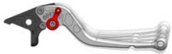
Positionen Bremshebel: 1 näher; 2 ca. Originalposition; 3-6 weiter

Die Standardversion der LSL Hebel ist für den Zugriff der ganzen Hand gemacht. Die kurze Version ist bestens geeignet für gut funktionierende Bremsanlagen und bietet Platz für den Zugriff mit drei Fingern. Auch diese kurze Ausführung wird mit ABE geliefert.