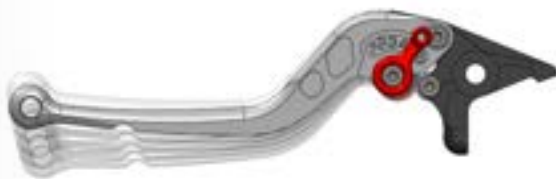
Positionen Kupplungshebel: 1-4 näher; 5 ca. Originalposition; 6 weiter.

Hebelende (lange- und X-Version) dient als Sollbruchstelle und ermöglicht so auch nach einem Sturz die ausreichende Funktion der Hebel.